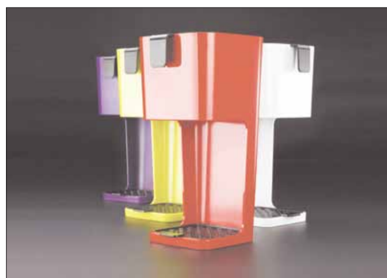
Kaffeegenuss auf bewährte Art neu entdecken: Koziol präsentiert den Kaffeebereiter UNPLUGGED bei der Konsumgütermesse Ambiente.

über 6% im Einzelhandel beschäftigt sind? Haben Sie wahrgenommen, dass sich der Dienstleistungssektor seit dem Jahr 1990 verdreifacht hat und hier auch die Bereiche Unternehmensberatung, Kommunikation und IT bedeutend sind? Nachzulesen ist all das im IHK Landkreispotrat für den Odenwaldkreis. Die IHK macht u.a. „einen gewachsenen und innovativen Mittelstand als industrielle Basis des Odenwaldkreises aus“ und schätzt die „zentrale geographische Lage“. Und die IVO-Mitgliedsbetriebe ergänzen noch als großen regionalen Vorteil den hohen Qualifikationsgrad der Bevölkerung. Die Wirtschaft betrachtet diesen Standort als stark und ausbaufähig. Wir haben also eine Vielzahl von „Jockern“ auf der Hand und es ist Zeit, diese Möglichkeiten zu nutzen für eine aktive Wirtschaftsförderung und ein innovatives, zielgerichtetes Standortmarketing, um genau die oben